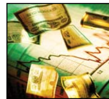
ACCIONES Y BONOS

Un sistema hecho a medida, cada empresa elige las opciones que mejor se adapten a su realidad y objetivos