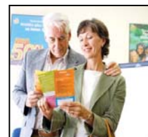
PLAN DE AHORRO