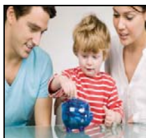
SEGURO DE VIDA