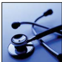
SEGURO DE SALUD